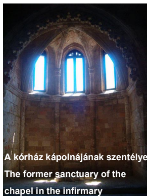
A kórház kápolnájának szentélye The former sanctuary of the chapel in the infirmary