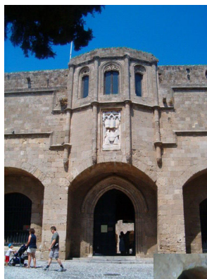
Az ispotály bejárata. The entrance of the infirmary