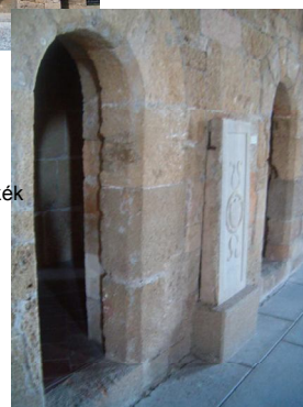
Különálló fülkék a terem oldalában. Separated niches at the Hall