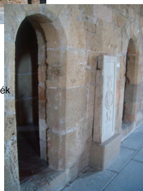
Különálló fülkék a terem oldalában. Separated niches at the Hall