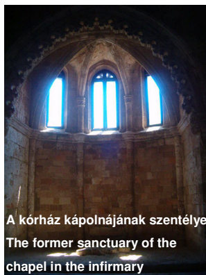
A kórház kápolnájának szentélye The former sanctuary of the chapel in the infirmary