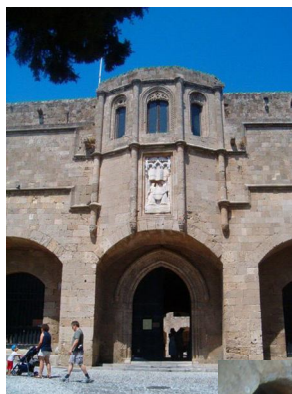
Az ispotály bejárata. The entrance of the infirmary