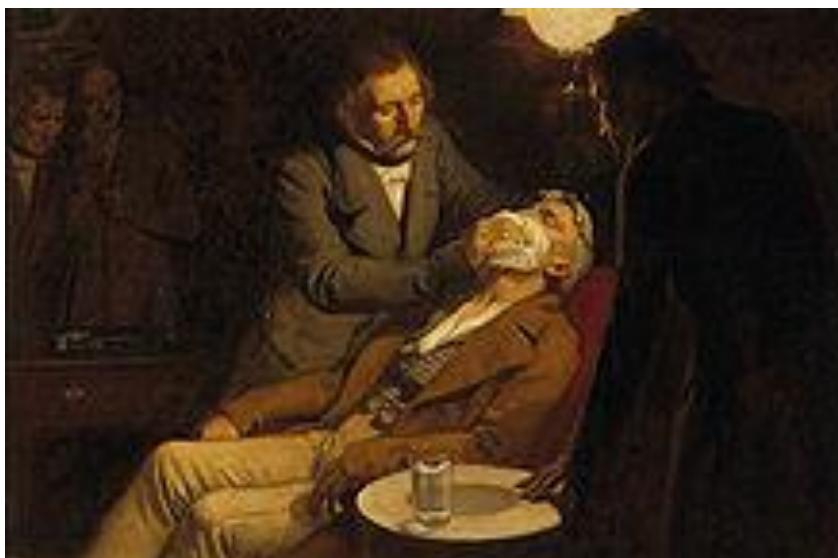
2. ábra. Éteraltatás 1846 – ban.

A magyar nyelvújítók kén – és sóégeny nek nevezték el. Levegővel és oxigénnel keverve égő és lobbanékony elegyet alkot. Önmagában ma már igen ritkán alkalmazzák az orvosi praxisban, rendszerint csak kéjgázzal és oxigénnel együtt. A krimikben és a kémfilmekben gyakran látni, amint a tettes az áldozatát hátulról közelíti meg és egy éterrel átitatott zsebkendőt szorít az orra és szája elé. Ez a filmekben izgalmas, mutatós gyors bódító jelenet, de manapság a medicinába önmagában nem alkalmazzák, mert a beteg lassan alszik el. /2. ábra/.