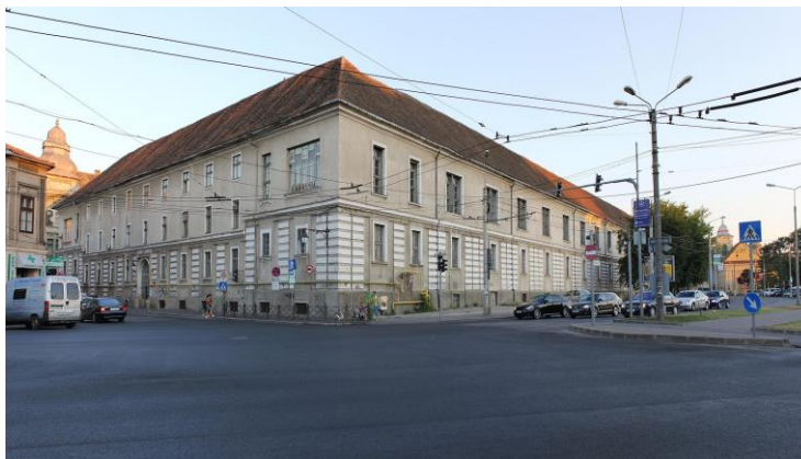
4. ábra. Temesvári Helyőrségi Katona Kórház. Épült 1764 – 1766 között.

működő fűtést, amit egy Medgyesi orvos – Paul Traugott Meissner – talált fel és vezetett be a Habsburg-monarchia számos kórházába. A temesvári Katonai Kórház több mint 250 éve, megszakítás nélkül működik. /4. ábra/