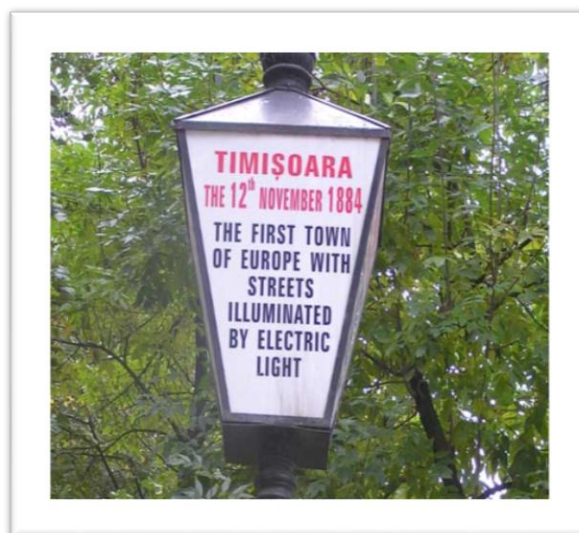
4. ábra. Temesvár a civilizált Európa élén.

Az Európában első temesvári éteraltatás történetét kevesen ismerhetik, de az utcai villanyvilágítás premierjéről bárki értesülhet a Hunyadi kastély előtti parkban. /5. ábra/