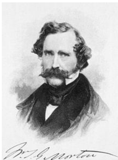
3. ábra. William Thomas Green Morton, bostoni fogorvos (1819 – 1868)