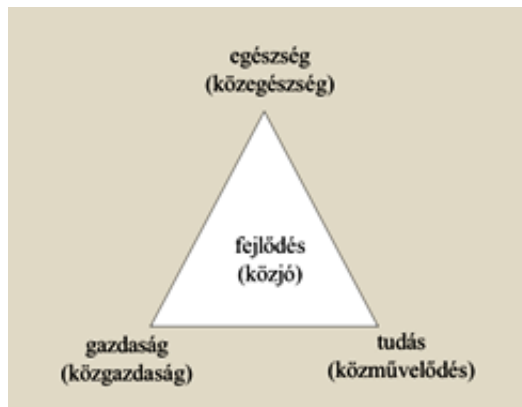
1. ábra: Egészség, gazdaság és tudás hármasságának összefüggése a centralisták liberális eszmerendszerében

Michel Foucault gondolatmenetéhez visszatérve: a francia történész-filozófus szerint a korabeli felvilágosult-tudományos gondolkodás a népesség egyik legfontosabb jellemzőjének azt tekintette, hogy a népességet alkotó egyének biológiai tulajdonságokkal rendelkeznek; az egészség, betegség, népesség kérdését problematizálni kezdő (bio)hatalom számára az állampolgárok ezért elsősorban biológiai tényezőkként jelentek meg. Az emberi élet – amely korábban csupán az alattvalók létezésének egyszerű biológiai hátterét jelentette – a hatalom számára elsőrendűen fontos ellenőrzési területté vált (Kiss 1995: 57-59). Az életfolyamatokat mérni, értékelni, dokumentálni kezdték, és megkezdődött az egészségügyi rendszernek (mint a népességet szabályozó apparátusnak) a kiépítése is. Ennek nyomán a különböző tudományterületek (például a demográfia, a statisztika és a közegészségtan) egyre nagyobb szerepet kaptak az állami élet irányításában, a kormányzás létfontosságú támaszai lettek.