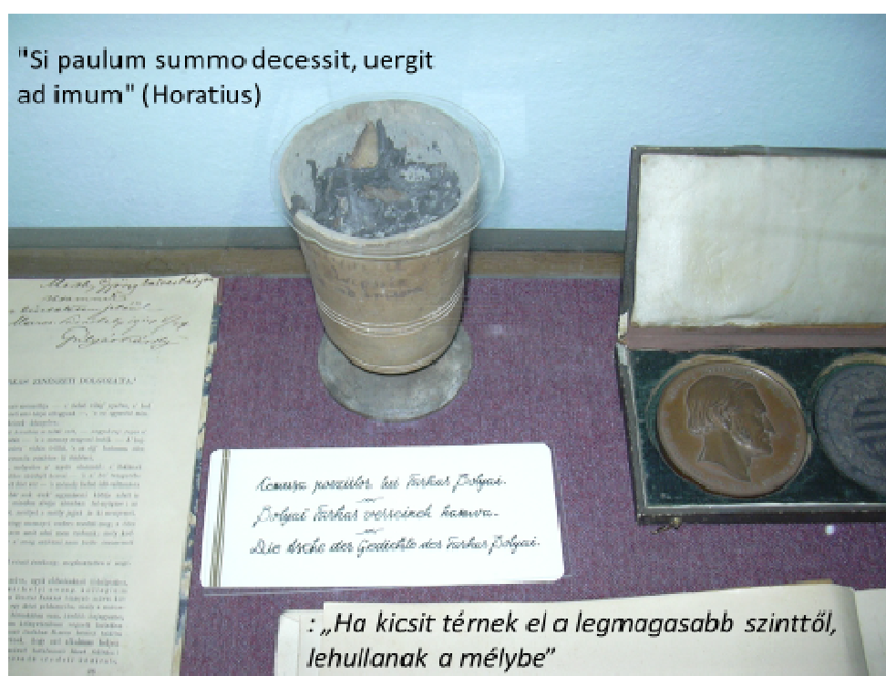
4. ábra Bolyai Farkas verseinek hamvvedre, a marosvásárhelyi Bolyai- Múzeumban

A két Bolyai maradványt alkotott a matematikán kívül, fizikában, a nyelvészetben, az orvos történetben és az irodalomban.