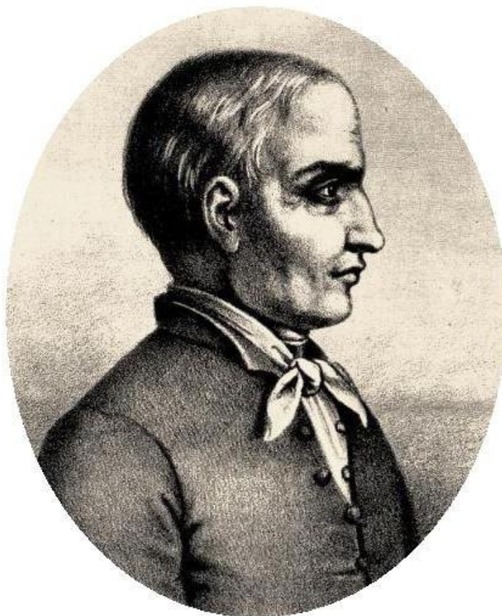
2. ábra Kőrösi Csoma Sándor (1784-1842)

Nagyon sok közös ismerős, tanár, jó barát található Kőrösi Csoma Sándor is és Bolyai Farkas között! A magyar tudomány lényegében Bolyai Jánossal és Kőrösi Csoma Sándorral lépett be a nemzetközi vérkeringésbe és elismertségbe.