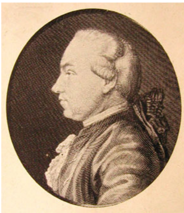
1. ábra Plenck J.J.

STOLL, J.: Staatswissenschaftliche Untersuchungen und Erfahrungen über die Medizinalwissenschaft . Zürich. 1812.