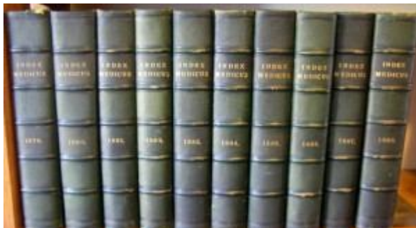
4. ábra Az Index Medicus régi, bekötött kötetei