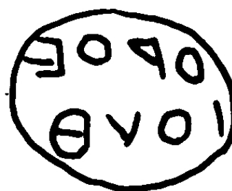
Fig. 3. 398b rajza

A köpöly alakú anyaméh mellett világosan látszik a kulcs, amelynek segítségével az uterust mágikusan nyitni-zárni lehetett. 3 Meglepő, hogy a kiváló gemmakutató, aki nem fényképen látta a követ, hanem kezében tartotta, évtizedekkel Bonner monográfiájának, vagy Barb részletes tanulmányának megjelenése után nem jött rá, mit ábrázol a szimbólum. A sokáig azonosítatlan ábrázolás értelmezése Delatte 1914-es tanulmánya óta terjedt el, bár Bonner felhívja rá a figyelmet, hogy már előtte is voltak kutatók, akik uterusként interpretálták azt. 4 A bukaresti gemma tehát eggyel gyarapítja a kulcsos uterusábrázolások csoportját. 5