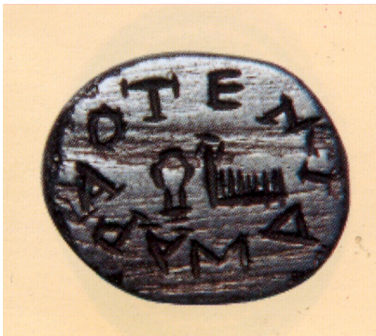
Fig. 1. 398a fényképe

A kiváló tudós, Mihai Gramatopol özvegye, Viorica Gramatopol sajtó alá rendezi a kutató összes műveit. Ezek közé tartozik Gramatopol 1977-es román nyelvű doktori disszertációjának megjelentetése, amely kiváló színes fényképeket közöl a bukaresti gemmagyűjtemény darabjairól. A 398-as gemma A oldalát a 15. táblán találjuk meg. 2 Erről készült a rajzom, amit a fénykép mellett közzéteszek.